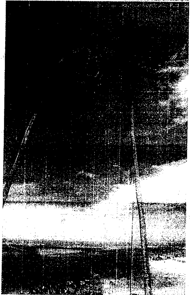
RUSTICIDADE - Fãs definem o local como 'paisagem fantástica'