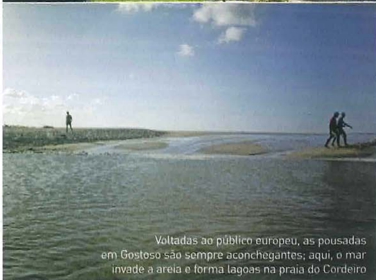
Voltadas ao público europeu, as pousadas em Gostoso são sempre aconchegantes; aqui, o mar invade a areia e forma lagoas na praia do Cordeiro

TRILHA SONORA: CAETANO VELOSO – CAETANO VELOSO – UNIVERSAL, 1969 ▶ PLAY: FAIXA 6 – “NÃO IDENTIFICADO”