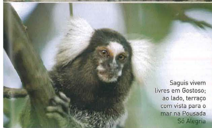
Saguí vivem livres em Gostoso; ao lado, terraço com vista para o mar na Pousada Só Alegria